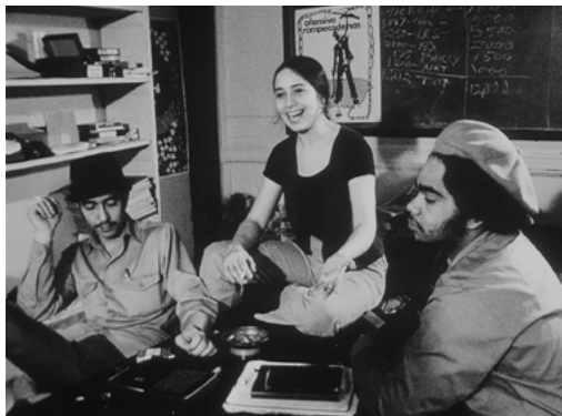
El pueblo se levanta (Newsreel Coop, Estados Unidos, 1971)

FILMOTECA ESPAÑOLA. CINE DORÉ. SALAS 1 Y 2. MIÉ 27 MAYO - SÁB 30 MAYO | WED 27TH MAY - SAT 30TH MAY