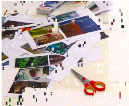
Con las manos en la imagen

TALLER. MATADERO MADRID MIÉ 27 MAYO, JUE 28 MAYO | WED 27TH MAY, THU 28TH MAY