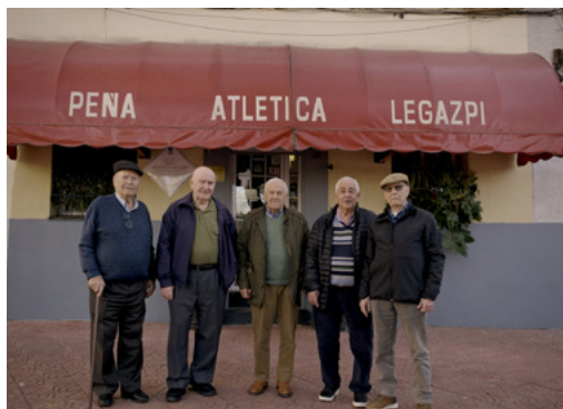
Vial Matadero (Juan Cavestany, España, 2026)

CINETECA. SALA AZCONA DOM 31 MAYO, 20:00H | SUN 31ST MAY, 8:00 PM