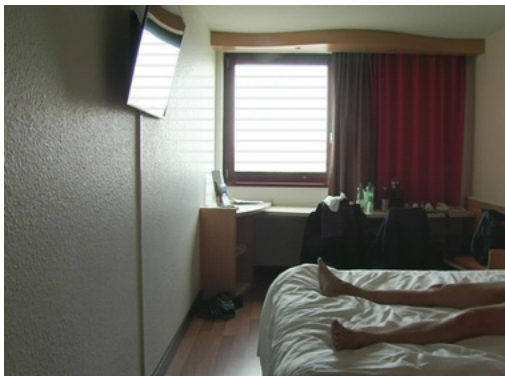
Erwartungen (Jan Soldat, Alemania, 2020)

GOETHE-INSTITUT, CINETECA Y ECAM MIE 27 MAYO - SÁB 30 MAYO | WED 27TH MAY - SAT 30TH MAY