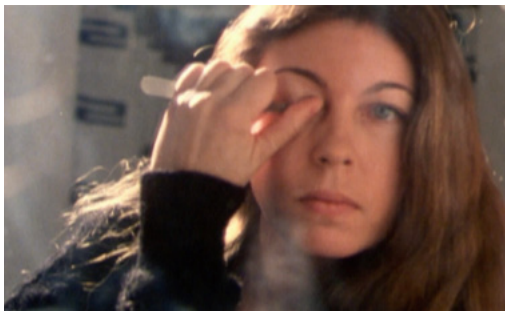
Diario inacabado (Marilú Mallet, Canadá, 1982)