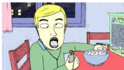
Je sors acheter des cigarettes