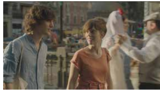
La virgen de agosto Jonás Trueba, España, 2019, 125' De 1 X. 25 a 1 D. 29

Madrid, agosto, calor, y una mujer madrileña que decide vivir el verano como si fuera una turista en su propia ciudad. Con el comienzo de curso, y los recuerdos estivales todavía en la piel, recuperamos la última película de uno de nuestros cineastas más queridos, Jonás Trueba, rodada íntegramente en Madrid entre el 1 y el 15 de agosto del año pasado. Verano, tiempo de azares, revelaciones, y miradas al futuro.