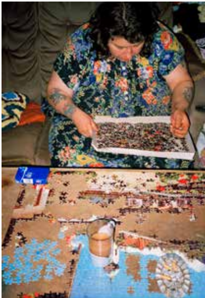
Sin título, 1995. Richard Billingham