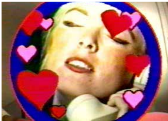
Id Came From Inner Space