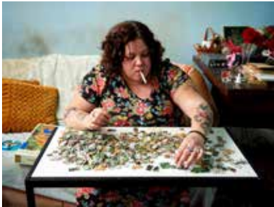
Ray & Liz Richard Billingham, Reino Unido, 2018, 107' De 1 V. 06 a 1 J. 12

Nada más extraño que la familia propia. Nada más mentiroso que un documental. Nada más cierto que una ficción. Nada más inexacto que una afirmación tajante. Recibimos en Cineteca una de las grandes películas de la temporada, RAY & LIZ , del fotógrafo británico Richard Billingham.