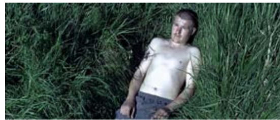
La vida de Jesús

La vida de Jesús (La vie de Jésus) Bruno Dumont, Francia, 1997, 96' D. 07 y J. 11