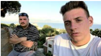
Selfie Agostino Ferrente, Italia-Francia, 2019, 76' Del V. 12 al D. 21

Exiliados y rodeados por el vacío, el desierto y el silencio de la comunidad internacional, los refugiados saharauis sobreviven a la rutina. Los jóvenes protagonistas afrontan con humor el encierro en esta prisión sin rejas convertida en su hogar. Lo que podría haber sido un trabajo más sobre los campos de Tinduf, bajo la mirada de Eloy Domínguez Serén se convierte en un film jovial, luminoso y pleno de inventiva, premiado en festivales como Cinéma du Réel, Gijón, o DA Film Festival Barcelona.