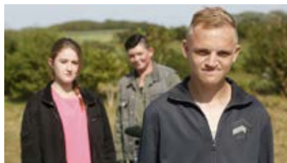
Coincoin et les z'inhumains Bruno Dumont, Francia, 2018, 208' De1 V. 26 a1 D. 28