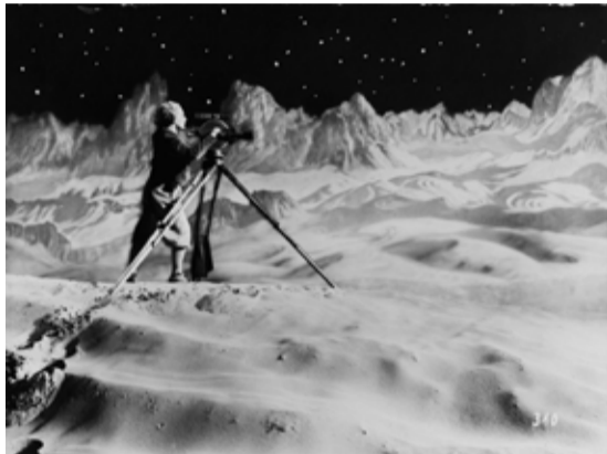
La mujer en la luna

Todo hombre recuerda las primeras palabras de Neil Amstrong tras pisar la superficie lunar, el 20 de julio de 1969. Pocos recuerdan, en cambio, las de su compañero Buzz Aldrin: "Magnífica vista. Magnífica desolación". ¿Qué vio Aldrin, dónde están esas imágenes, cómo era esa desolación? Cuando se cumplen 50 años del alunizaje del Apolo 11, Cineteca revisita los caminos cruzados del cine, la ciencia y la exploración lunar, y recorre las imágenes con las que el cine soñó la luna y el espacio exterior. Con películas de Fritz Lang, George Méliès, Michelangelo Antonioni, Agustí Villaronga, Rosa Barba, James Benning, Stan Brakhage y muchos más. Ver la luna sin estar en la luna.