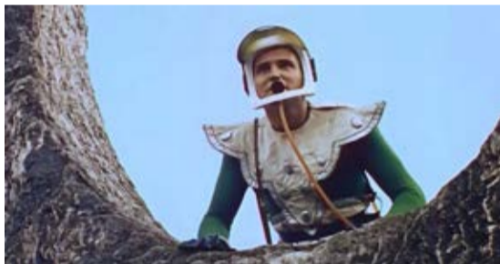
Nude on the moon