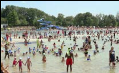
L'île au trésor

¡Cine al aire libre! Los mejores estrenos de cine independiente vuelven a la Plaza Matadero. De jueves a domingo, durante todo el mes de agosto, cine gratuito con las mejores películas internacionales, inéditas en Madrid. 20 joyas sin estreno comercial en salas españolas, que llegan precedidas por sus éxitos en festivales y pantallas de todo el mundo.