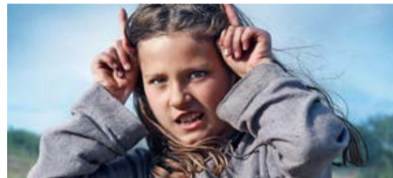
Jeannette. La infancia de Juana de Arco

En diálogo con el estreno exclusivo en Cineteca de la última locura del cineasta francés, Coincoin et les z'inhumains , recuperamos algunas de sus anteriores películas, incluyendo El pequeño Quinquín , obra seminal del juego de absurdos y exploraciones cinematográficas por las que camina el alocado cine de Dumont: un cineasta libérrimo, pop y aparentemente ligero, pero tan preocupado por la banalidad de lo cotidiano como por el cine como un arte disfrutable, popular y gozoso. Absurdo, carcajadas y cine en estado puro.