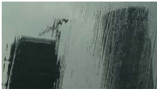
The Yellow Bank