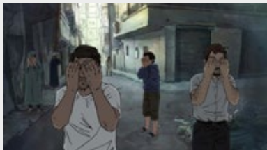
Zero Impunity (Nicolas Blies, Stéphane Hueber-Blies, Denis Lambert, 2019)