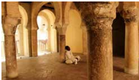
Ismael, el último guardián (Dir. Miryam Pedrero)