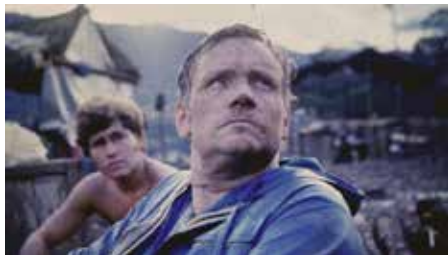
Tayos (Dir. Miguel Garzón)