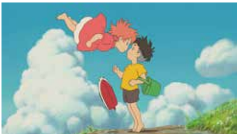
Ponyo en el Acantilado (Dir. Hayao Miyazaki)