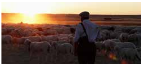
El pastor (Dir. Jonathan Cenxual Burley)