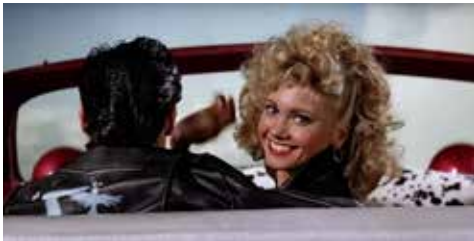
Grease (Dir. Randal Kleiser)

+ información en díptico especial y en cinetecamadrid.com