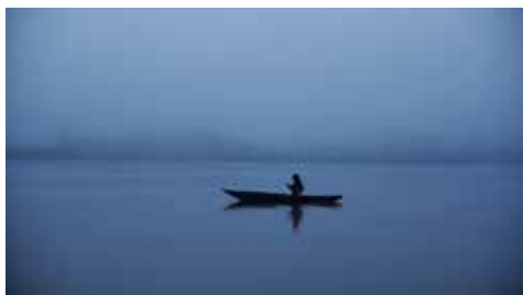
Sigo siendo (Dir. Javier Corcuera)